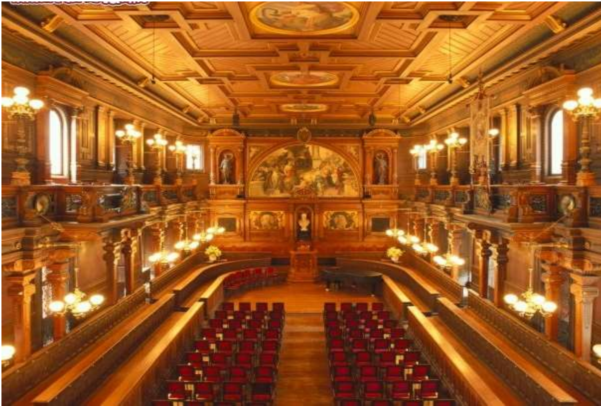
Universidad de Heidelberg