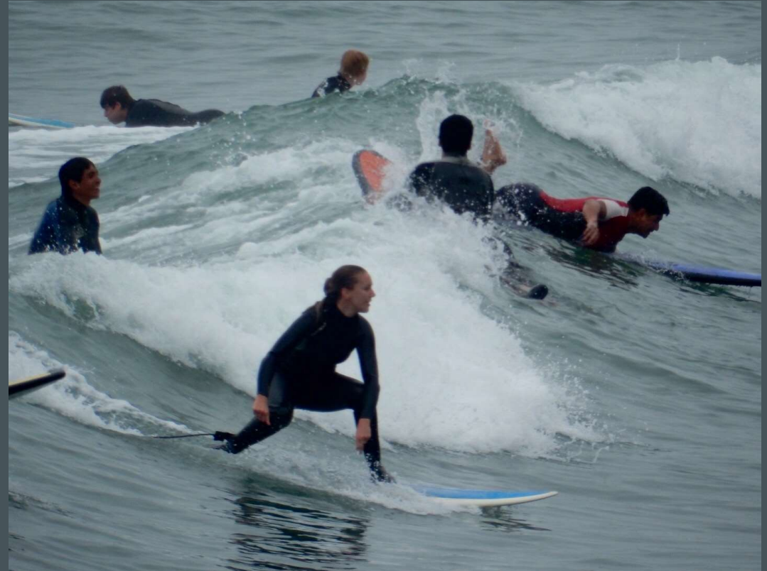
Miraflores, Lima, Perú